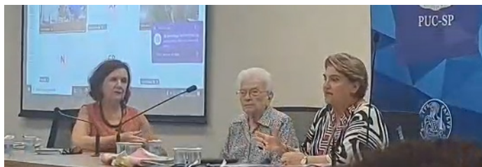
A Profª Mari Pitarelo, a Deputada Luiza Erundina e a Ministra Márcia Lopes

Márcia lembrou de seus momentos como puquiã e finalizou “Não queremos que neste ano se repitam os 268 feminicídios no Estado de São Paulo e 220 de estupros por dia no Brasil, além de outras situações de violência.”