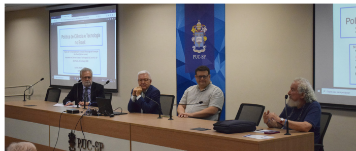
A mesa do debate Política de Ciências e Tecnologia no Brasil