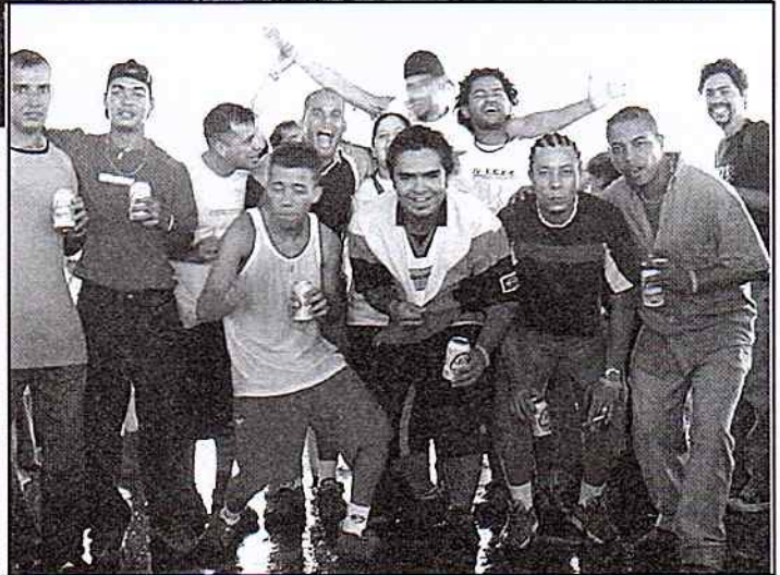
Foram quase 10 horas de muita alegria e agitação