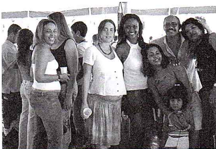
Uma festa com muita mulher bonita e muito homem assanhado