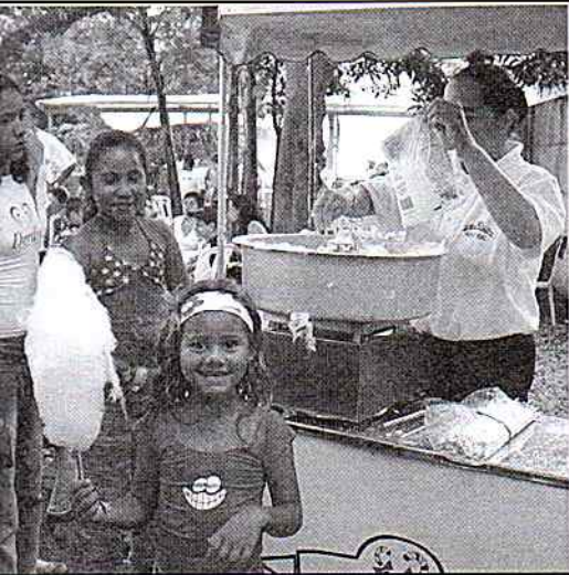
As crianças não ficaram de fora, com muito algodão doce e os tradicionais presentes do Papai Noel Tamarindo