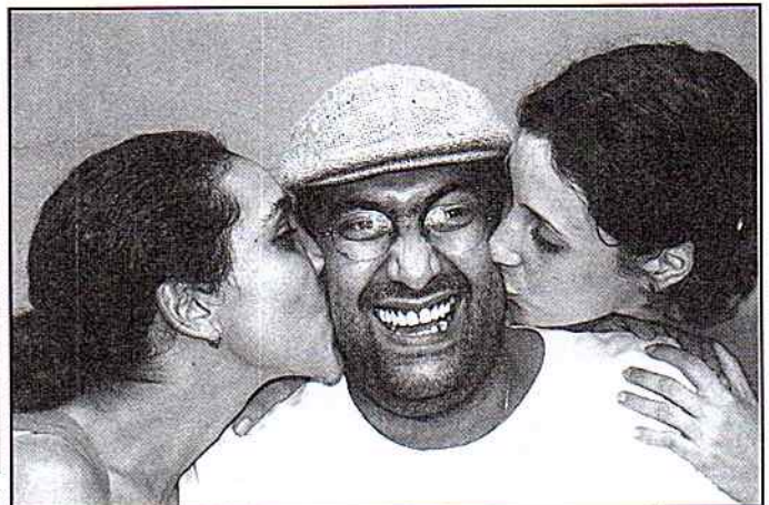
As vantagens de ser presidente da associação