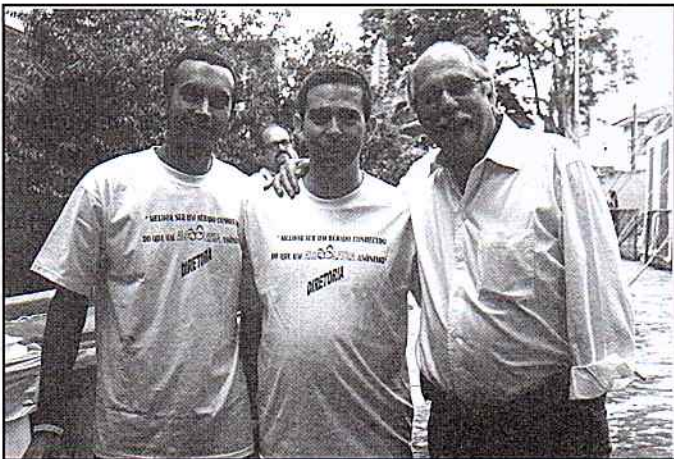
A confraternização dos funcionários com o reitor