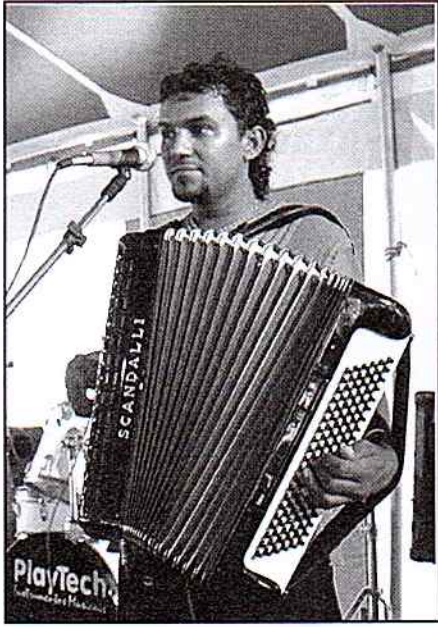
O forró ficou por conta do grupo Chamego