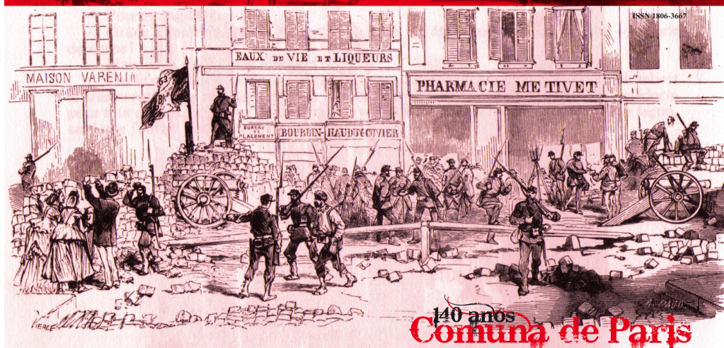
Capa do número especial da revista PUCviva sobre a Comuna de Paris