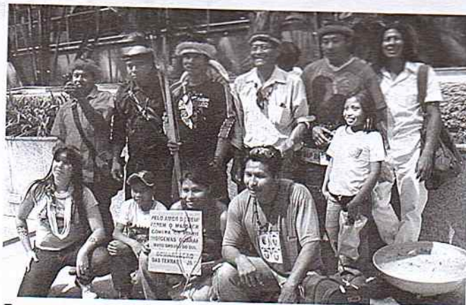
Representantes da aldeia Laranjeira Nhanderu viajam a São Paulo para acompanhar decisão sobre suas terras

cebido o primeiro voto favorável e ter ganhado algum tempo até o julgamento ser remarcado, indígenas, movimentos sociais, militantes e profissionais que vêm acompanhando o caso permanecem em alerta. A expectativa é que o laudo técnico da terra indígena saia neste período. Assim como afirmou a Filgueiras: "Não é demasiado dizer que a única solução justa e definitiva para esse caso passa necessariamente pela finalização dessa perícia. Todas as demais soluções serão paliativas".