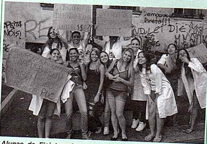
Alunas de Fisioterapia protestam no campus Monte Alegre

e conseqüentemente a elaboração dos contratos docentes. Apesar de todos estes problemas os diretores ainda não relataram casos de demissão, mas não foram poucos os casos de redução de contratos. Uma posição mais clara deverá acontecer nas próximas semanas quando todas as turmas forem definidas.